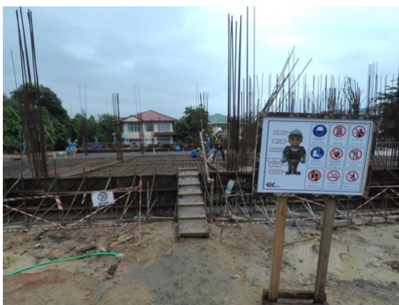
Regenwolken ziehen auf – 31. Mai 2018