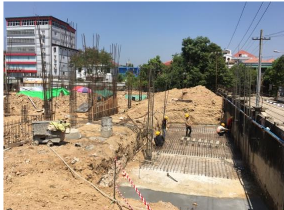
Situation am 6. April 2018