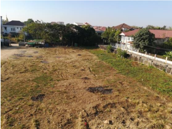
Baugrundstück am 2. Februar 2018