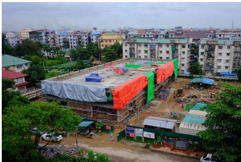
Situation am 24. August 2018

1) davon betreffen 1'474 zweckgebundene Zuwendungen der DEZA für die Entwicklungsprojekte